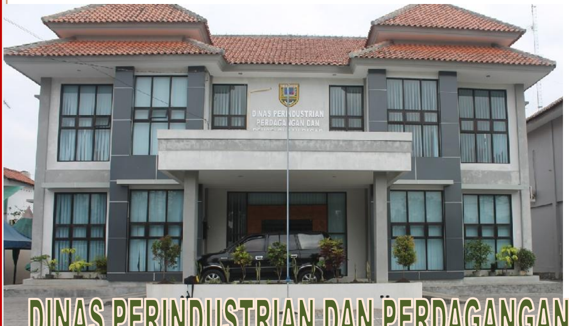
DINAS PERINDUSTRIAN DAN PERDAGANGAN KABUPATEN KEBUMEN